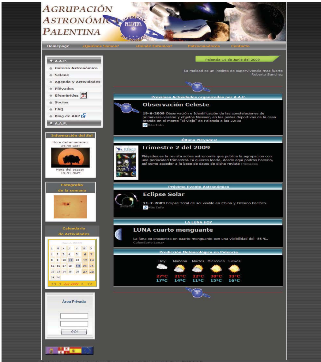
Img. 2: Página Web principal de la Agrupación Astronómica Paletina