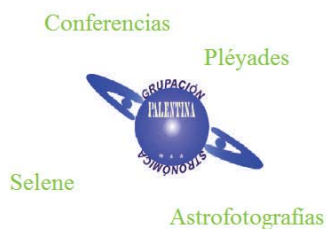
Img. 4. Página inicial de la Web de A.A.P hasta Junio de 2009