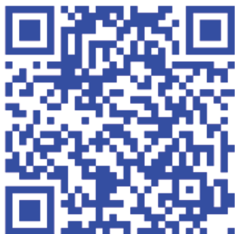
Img. 1: Código QR que representa http://www.agrupacionastronomicapalentina.org

Por último podremos ver también la hora y salida del sol en la zona de Palencia, así como una fotografía de nuestro álbum fotográfico que variará cada semana, y un calendario que permitirá acceder a las actividades planificadas o ya realizadas, a través de la fecha en que tuvieron o tendrán lugar.