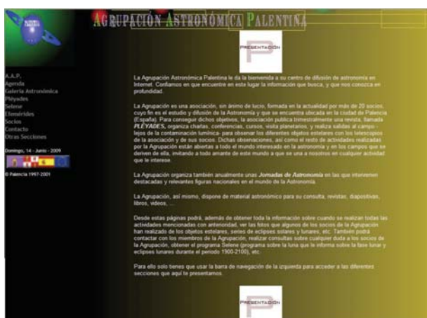
Img. 5. Página Web de presentación de la Agrupación hasta Junio de 2009