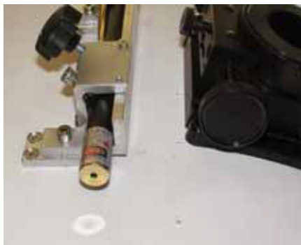
Soporte y puntero Láser.

picaduras de mosquitos, lo tedioso que es