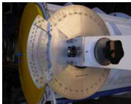
Disco en aluminio de los nonios.

de madera. Fijé el micro-taladro con una fresa de 3 mm en el tornillo del banco de trabajo y la madera con el disco también. Arrimando el disco poco a poco a la fresa y dando vueltas al disco pude quitar todas