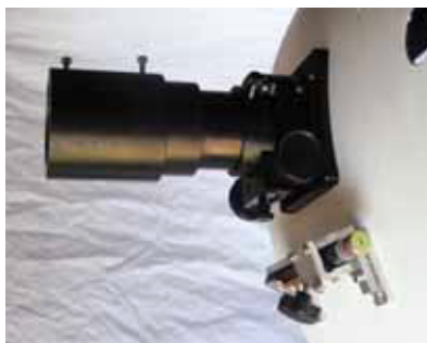
Casquillo adaptador cámara fotográfica y puntero Láser.

Los casquillos permiten colocar la cámara con o sin oculares con bastante margen de movimiento hacia dentro o fuera. Por lo menos espero que podamos hacer fotografías de objetos luminosos (la Luna y planetas sobre todo).