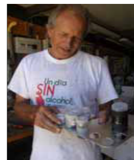
Porta oculares terminado.

De una chapa de aluminio corté un trozo de 300x160 mm. Redondeé las esquinas y con brocas "corona" hice primero agujeros de 38 mm para luego limarlos hasta 42 mm.