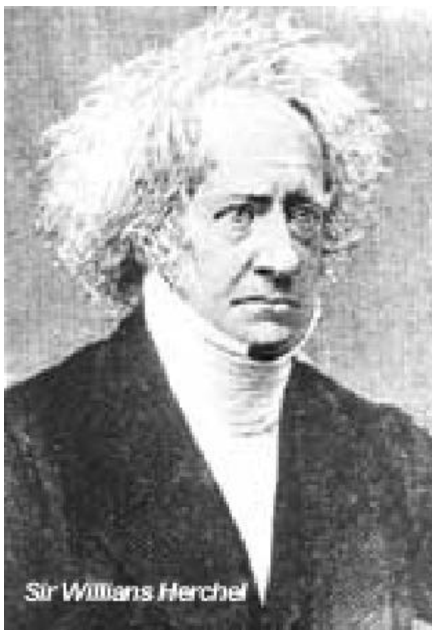
Sir William Herschel

Para explicar la diferencia entre sistemas galileanos y no galileanos. Aquí se trata de una cosa distinta. Mientras el tren corra por una vía rectilínea sin frenar ni acelerar, el tren y la Tierra son ambos sistemas