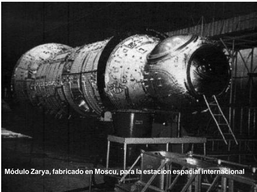
Módulo Zarya, fabricado en Moscú, para la estación espacial internacional

No sería necesario desarrollar nuevos lanzadores, solo modificar los actuales