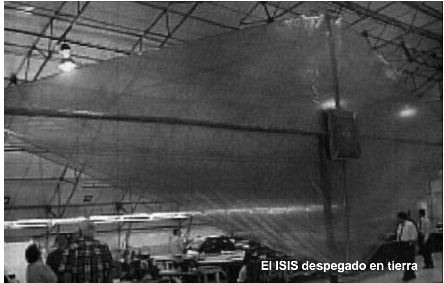
El ISIS despegado en tierra

Va a mejorar, debido a las nuevas tecnologías y a la microminiaturización en varios Ordenes de magnitud, lo cual es importantísimo